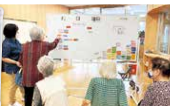
スケジュールボード