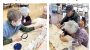
ベルマーク仕分け