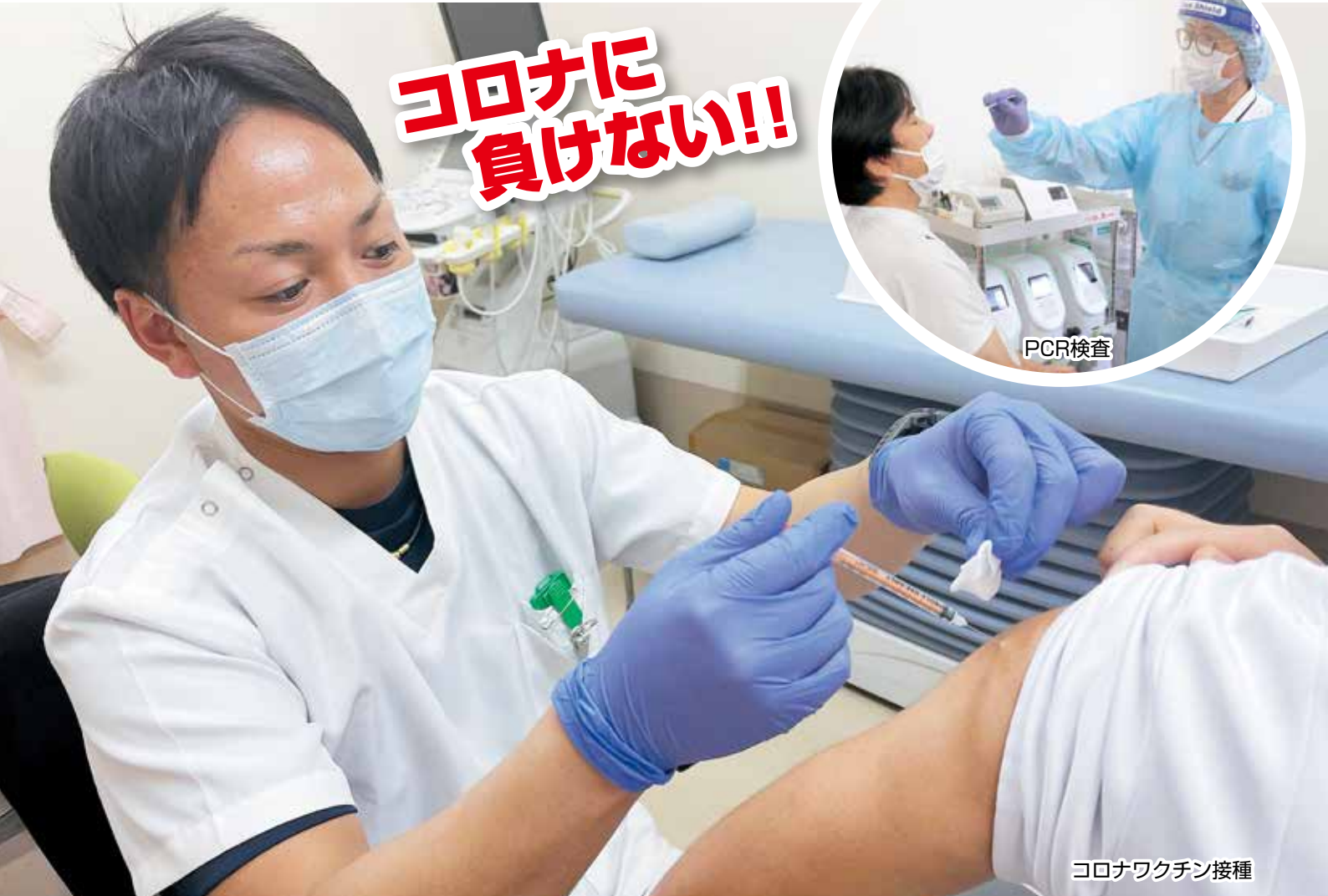
コロナワクチン接種