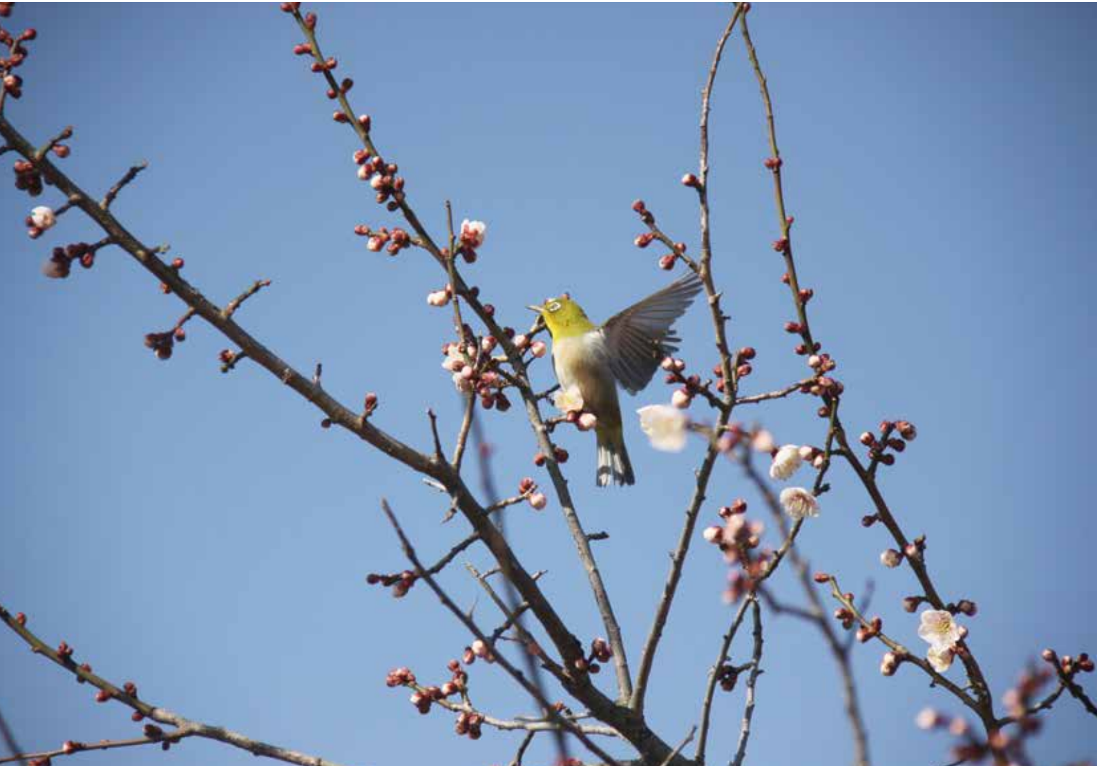
網敷天満宮の梅とメジロ