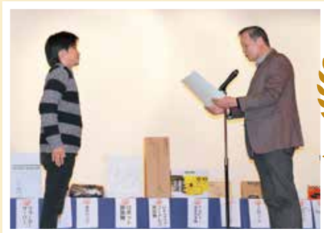
永年勤続 10年・20年表彰