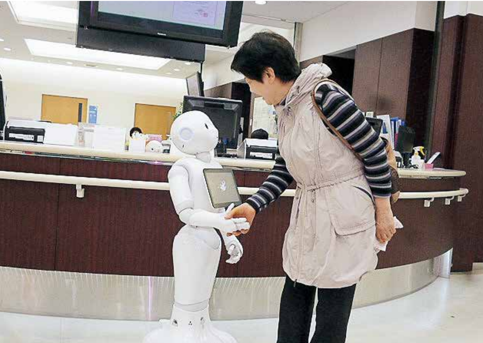
玄関に入るとペッパーくんがお出迎え。ペッパーくんの名前を募集しています!