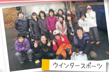
ウインタースポーツ