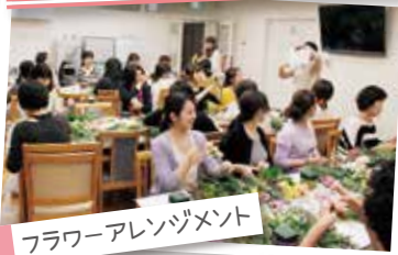
フラワーアレンジメント