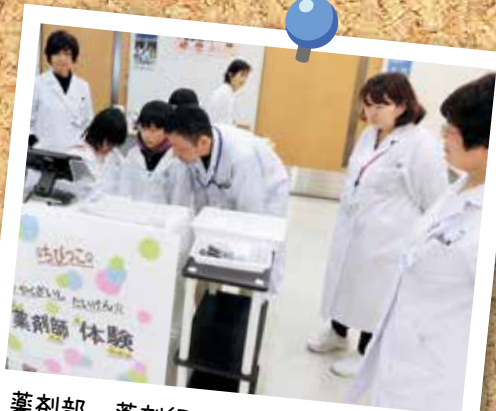
薬剤部 薬剤師体験 お薬のみ方相談