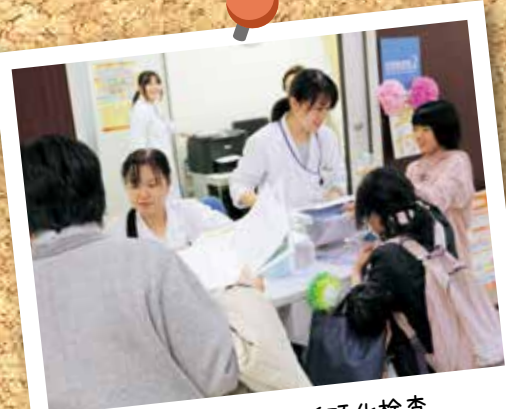
検査部 簡易動脈硬化検査