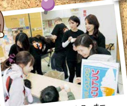
事務部 おもてなしコーナー