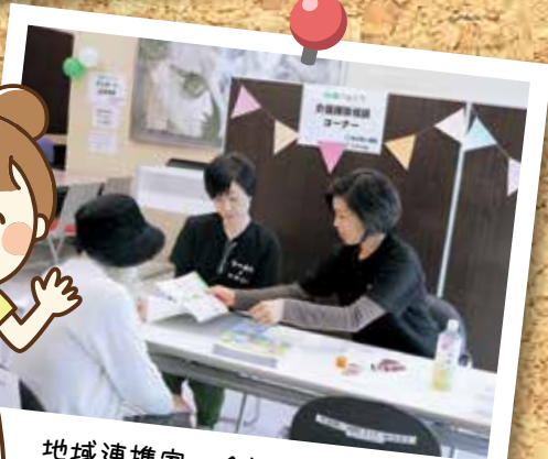
地域連携室 介護保険相談