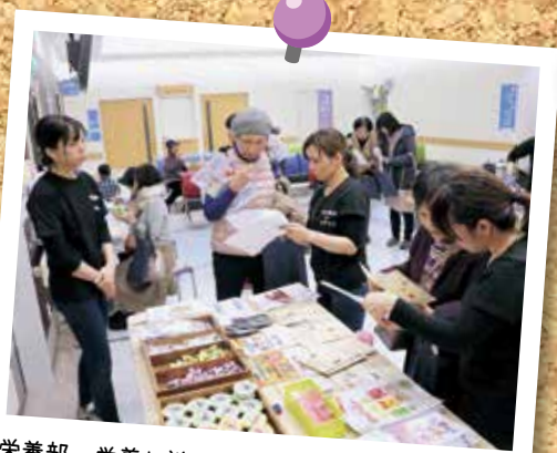
栄養部 栄養相談 カレー・低糖質スイーツ提供