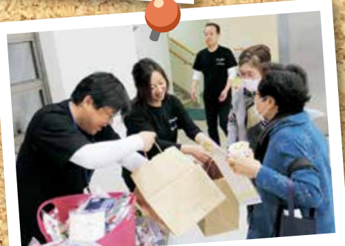
スタンプラリー つかみ取りコーナー