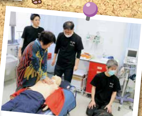
看護部 心臓マッサージ・AED使用体験