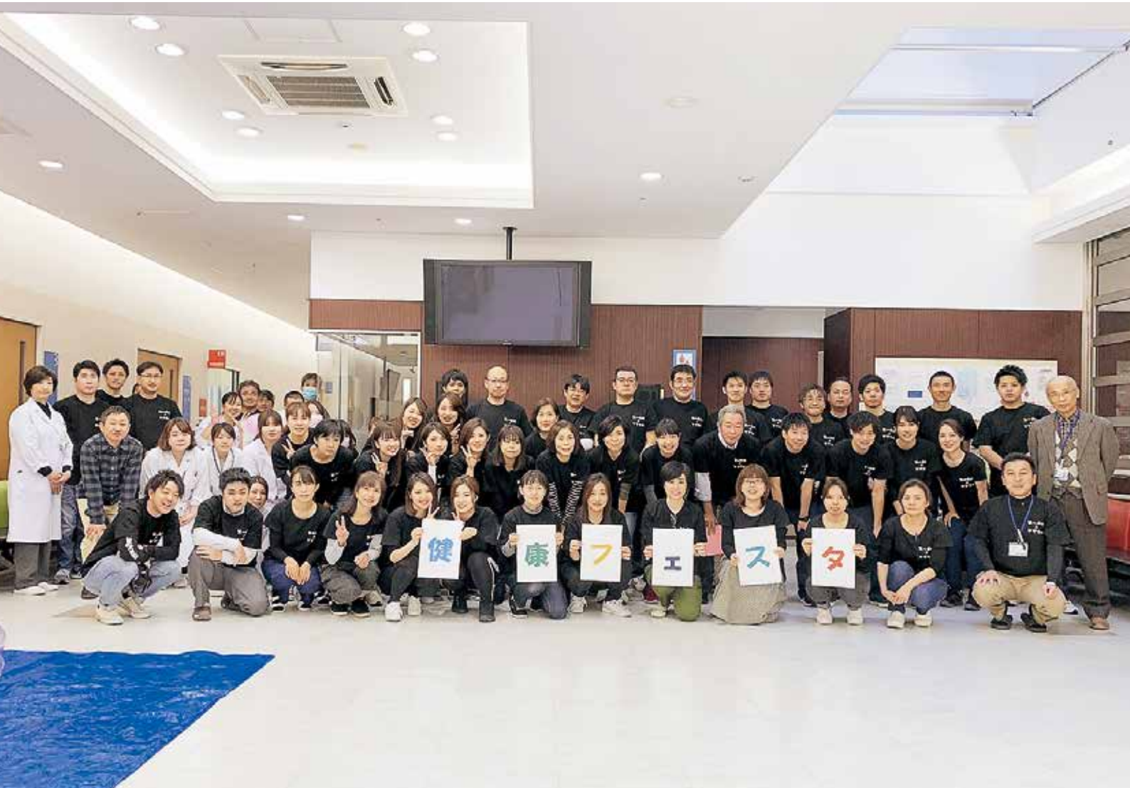
第1回健康フェスタ