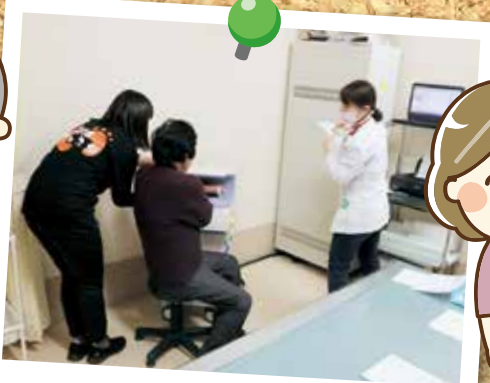
放射線部 骨密度測定