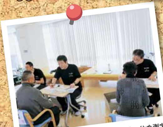
リハビリテーション部 生活・運動相談 体力測定