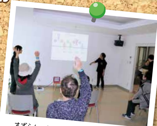
すずらん モットレ体験(詳細は7ページ)