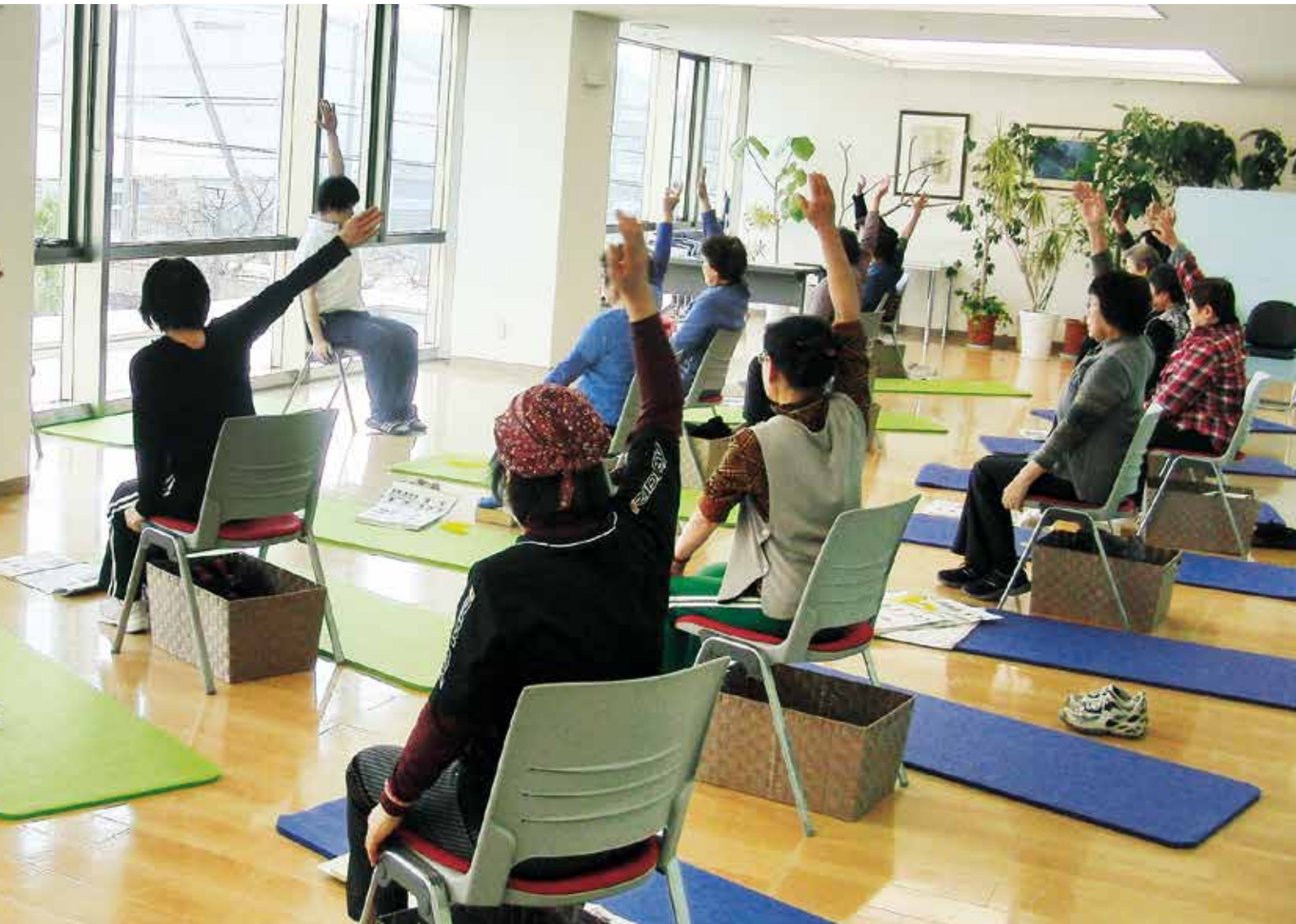
当院で実施している運動教室